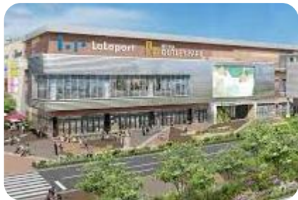
오사카 카도마 지점