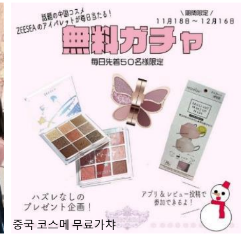
중국 코스메 무료가차